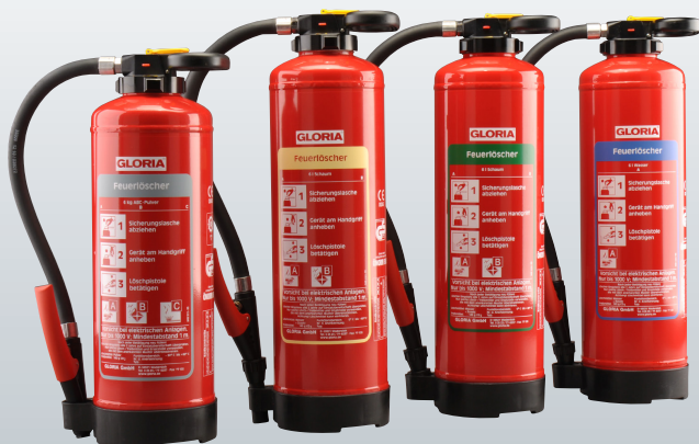
Pulver Schaum Öko-Tipp Wasser